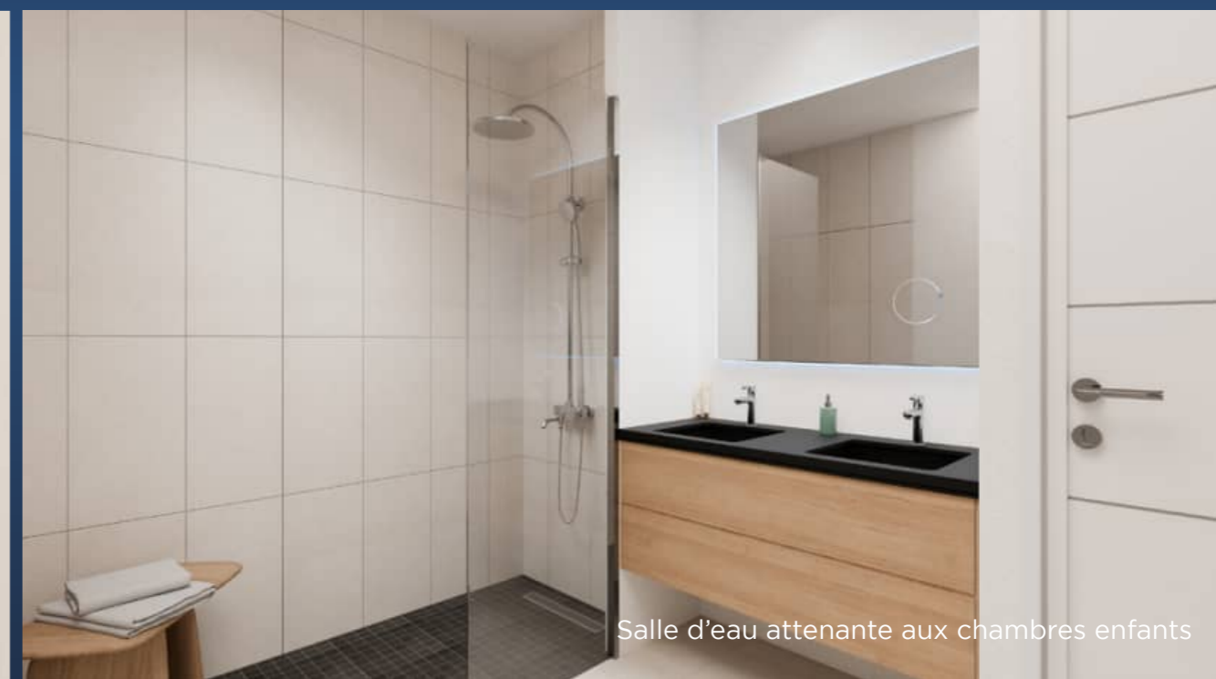
Salle d'eau attenante aux chambres enfants